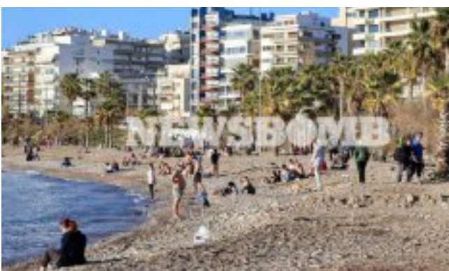
Greek New Year's Day (in Attica)