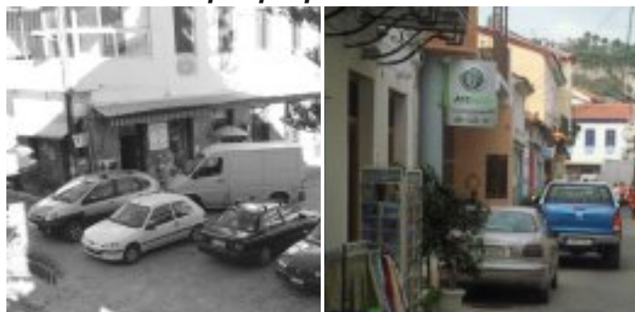
Επίκαιρες φωτογραφίες από το... 2012 & 2013!!!

Το έχουμε ξαναγράψει πολλές φορές: κάποιιοι βαριούνται, φαίνεται, να περπατήσουν 100 μέτρα και παρκάρουν τα αυτοκίνητά τους στην Περικλή Ράλλη -εμποδίζοντας την πρόσβαση στο ΑΤΜ της Τράπεζας Πειραιώς- στην πλατεία του Αγίου Δημητρίου, πάνω από την πλατεία στην στροφή του "Τία", στην Βιβλιοθήκη και αλλού.