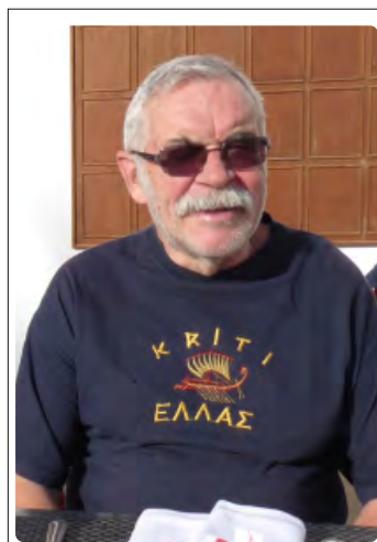
και στα παιδιά τους.