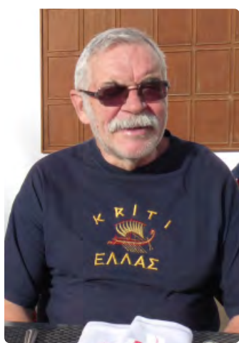
και στα παιδιά τους.